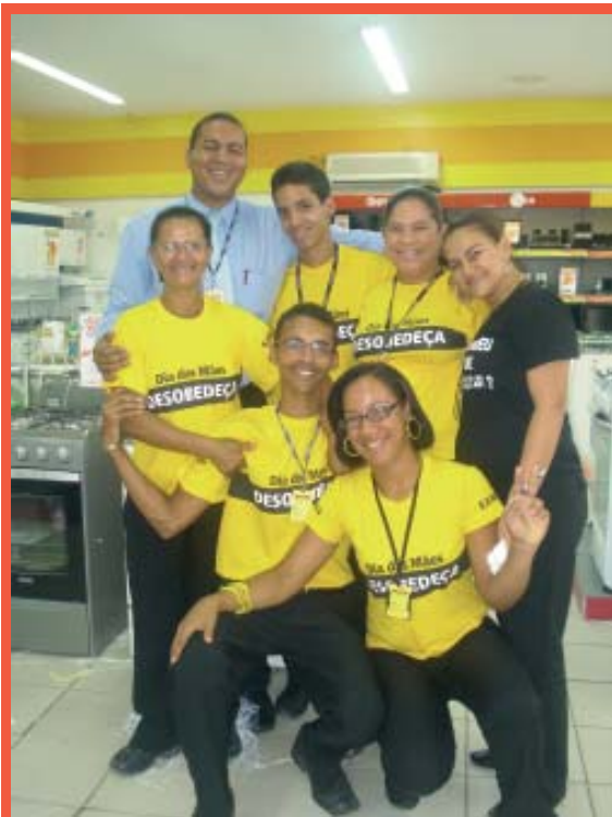
Vendedores da Ricardo Eletro também comemoram o 1º de Maio

O jornal Camaçari Notícias presta um homenagem a todos os trabalhadores pelo seu dia